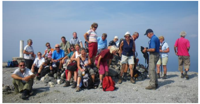
Rast am höchsten Punkt des Gran Cratere (391 m) auf Vulcano

Die Umrundung des Kraters und Besteigung des Gipfels, der Blick über den vom Schwefel gelb gefärbten Kraterrand, das Bad in dem Schlammbecken, angeblich heilend bei diversen Krankheiten, dann noch ein Bad im geothermal beheizten Meer – ein Erlebnis der Superlative, bereichert durch die fachlichen Erläuterungen unserer Geologen.