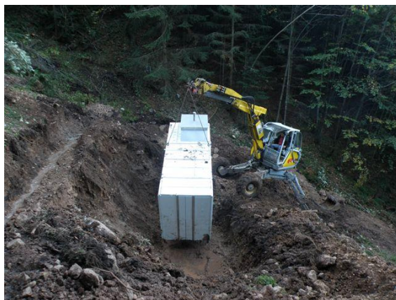
Einbau des Wasserbehälters

Die Arbeiten an der Trasse für die Verlegung der Leitungen von Wasser und Strom sind im Laufen: die Quelle ist bereits gefasst und der Wasserbehälter eingesetzt. Solange es das Wetter zulässt, werden die Baggerarbeiten zum Bau der Künette heuer noch weitergeführt!